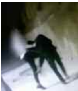
Fotogramma del pestaggio di Marsala

Tutti identificati e denunciati i tre aggressori minorenni di un loro coetaneo picchiato nei pressi del Palazzo Grattacielo a Marsala. La vicenda aveva avuto una vasta eco anche a causa di un filmato che è finito sui social e che è stato ulteriormente diffuso dal sito TP24.it che ha la redazione che si affaccia su via Taddei, luogo in cui è avvenuto il pestaggio della giovanissima vittima. Giovane tanto quanto il suo più accanito aggressore, un quattordicenne che era stato già denunciato il 24 gennaio scorso, quando il filmato è stato pubblicato. Ora sono stati identificati e denunciati alla magistratura minore anche gli altri due complici. Lo rende noto un comunicato della polizia che ha fatto sapere di avere interrogato, nei giorni scorsi, tutti i protagonisti alla presenza dei rispettivi genitori e dei legali di fiducia. Il più violento dei tre