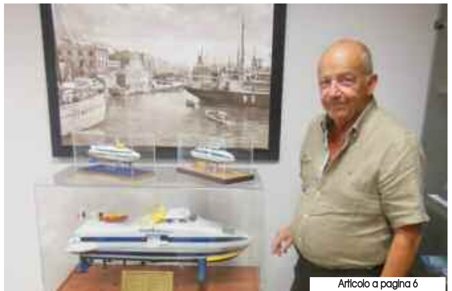
Articolo a pagina 6